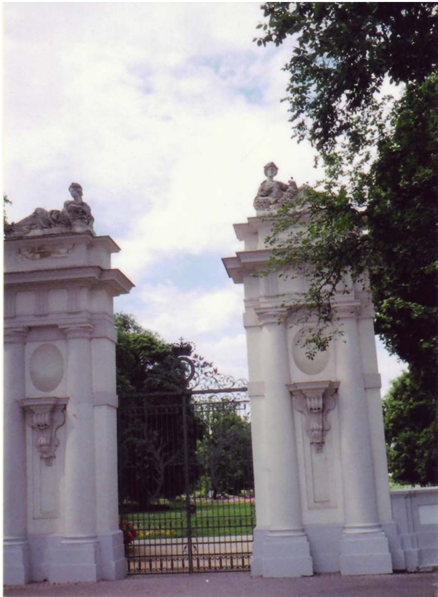
Schloßpark-Portal - S. 7: Schloß Oranienburg an der Havel, S. 15: Schloßhafen, S. 19: Blumenthal-sches Haus, S. 23: Bootshafen, S. 27: 1665 erbau-tes Waisenhaus