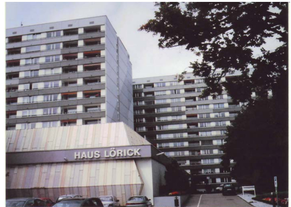
Zu Nr. 352 (VI '10), S. 1 – 16, und der Übungsauf- gabe dazu (Nr. 353, Seite B): das Altersheim in Düsseldorf-Oberkassel