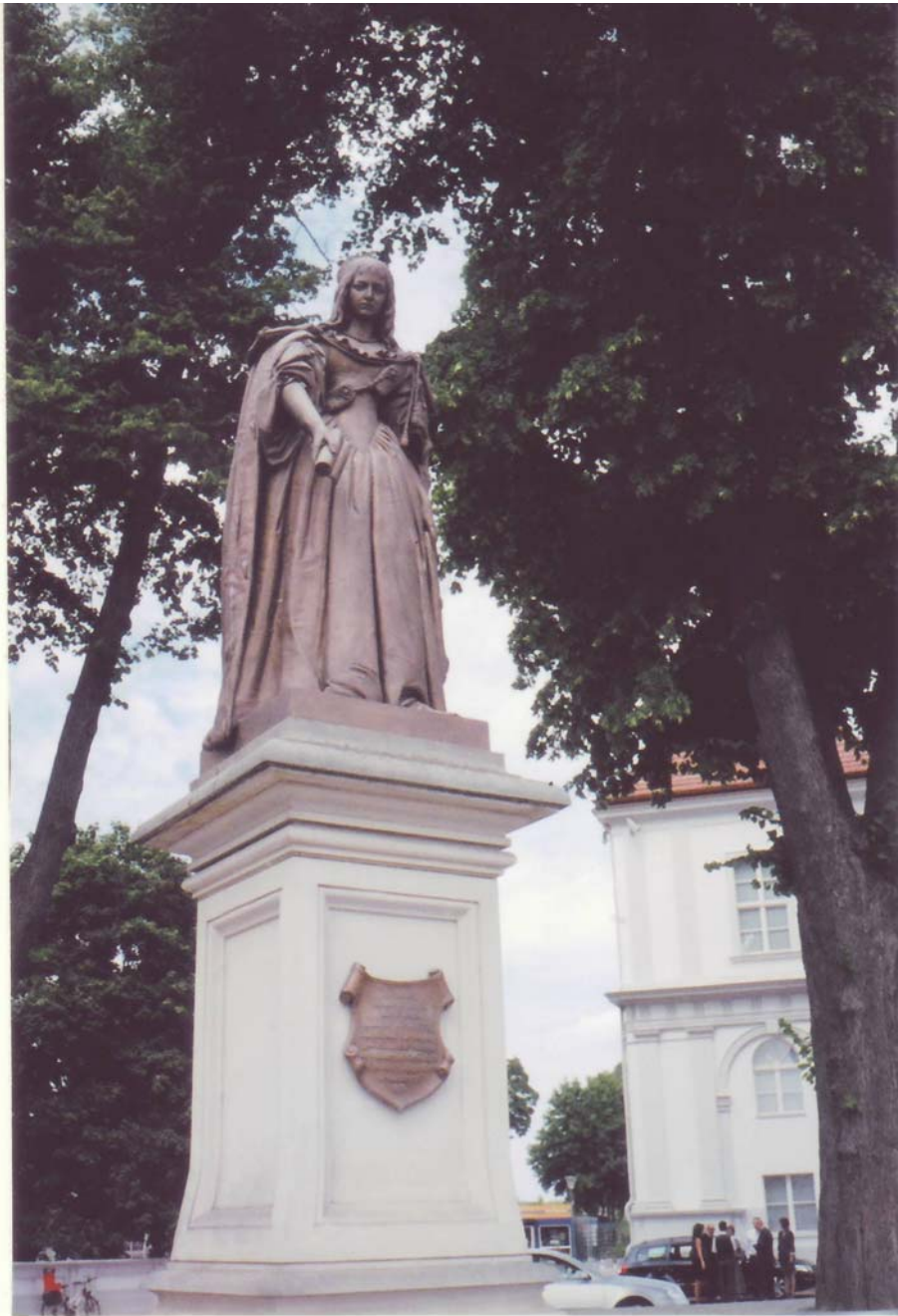
Vorm Schloß: Kurfürstin Luise Henriette

den Häusern gelegen hat, wie man, wie sie uns selbst berichtet haben, die Wäsche nicht [zum Trocknen] raushängen konnte, und wo man natürlich genau wußte, was passierte. Ja, es gab sogar Erschießungen unter den Augen der Bevölkerung. All dies passierte tatsächlich unter den Augen der Menschen.“