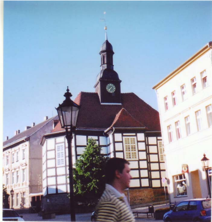
Zu Nr. 357, S. 1 - 37, Anm. 81: Bad Freienwalde im Oderland: Die Sankt-Georg-Kirche von 1696 ist jetzt ein Konzertsaal.

kehren können. Er hat sich gestern im Spiel seiner Leverkusener [Mannschaft] bei Hannover 96 eine Fraktur im Schienbeinkopf zugezogen und fällt voraussichtlich 6 Wochen aus. [...] Der 33jährige 5 hat[te] gerade erst die Folgen eines Bänderrisses überwunden. [...] Und das waren Radio-Bremen-Nach- richten. [...]