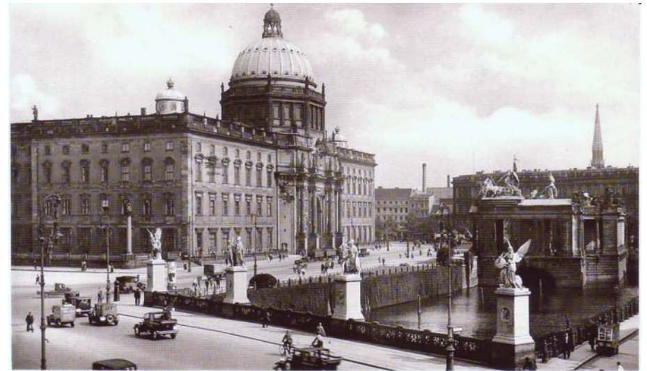
Zu Nr. 356 (X '10), S. 54 – 61: So sah das Stadt- schloß an der Spree um 1930 aus.

76) (Umgangssprache): besonders gut, sehr gut