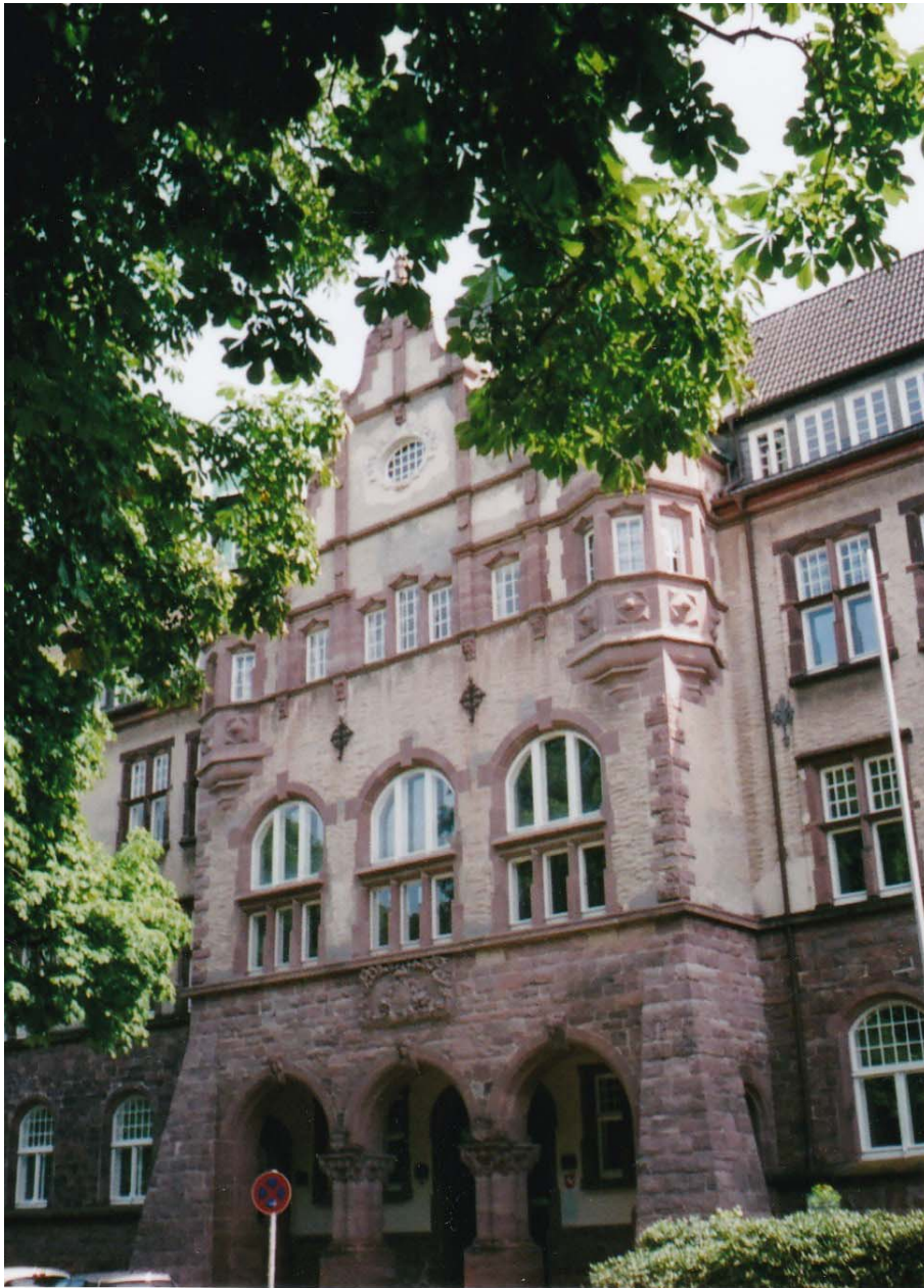
Das Oldenburger Landgericht wurde 1902 unter Kaiser Wilhelm II. erbaut. - Amtsgerichte: Königssteele (1879) in Westfalen (S. 7: 2. 7.), Prenzlau (1859) in Preußen (S. 11: 11. 5 7.) und Schopfheim (1857) in Baden (S. 15: 11. 9.)