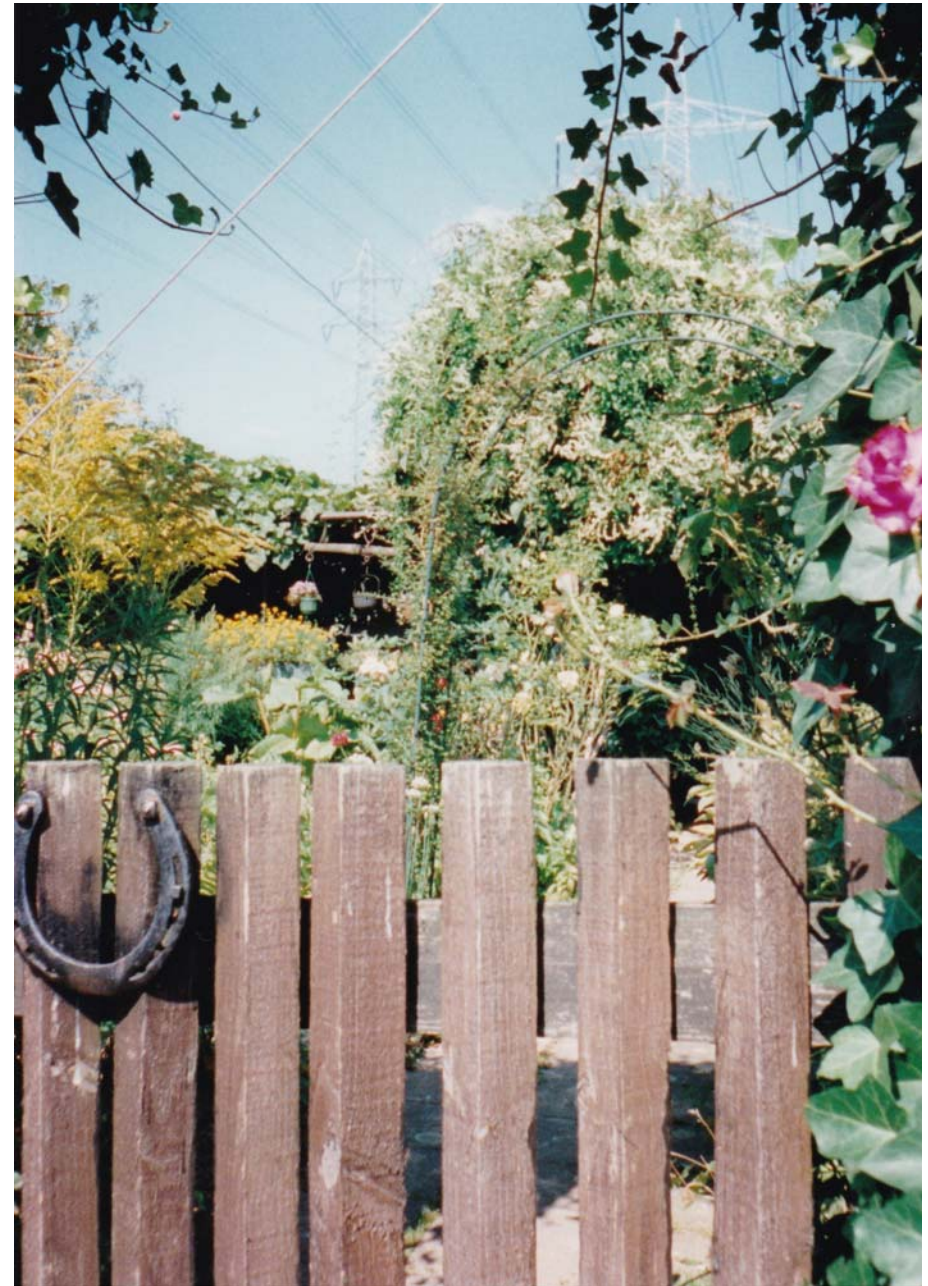
Frankfurt/Main: Kleingartenanlage (Nr. 250!): Das Hufeisen soll Glück bringen. - S. 29: Schwein am Spieß