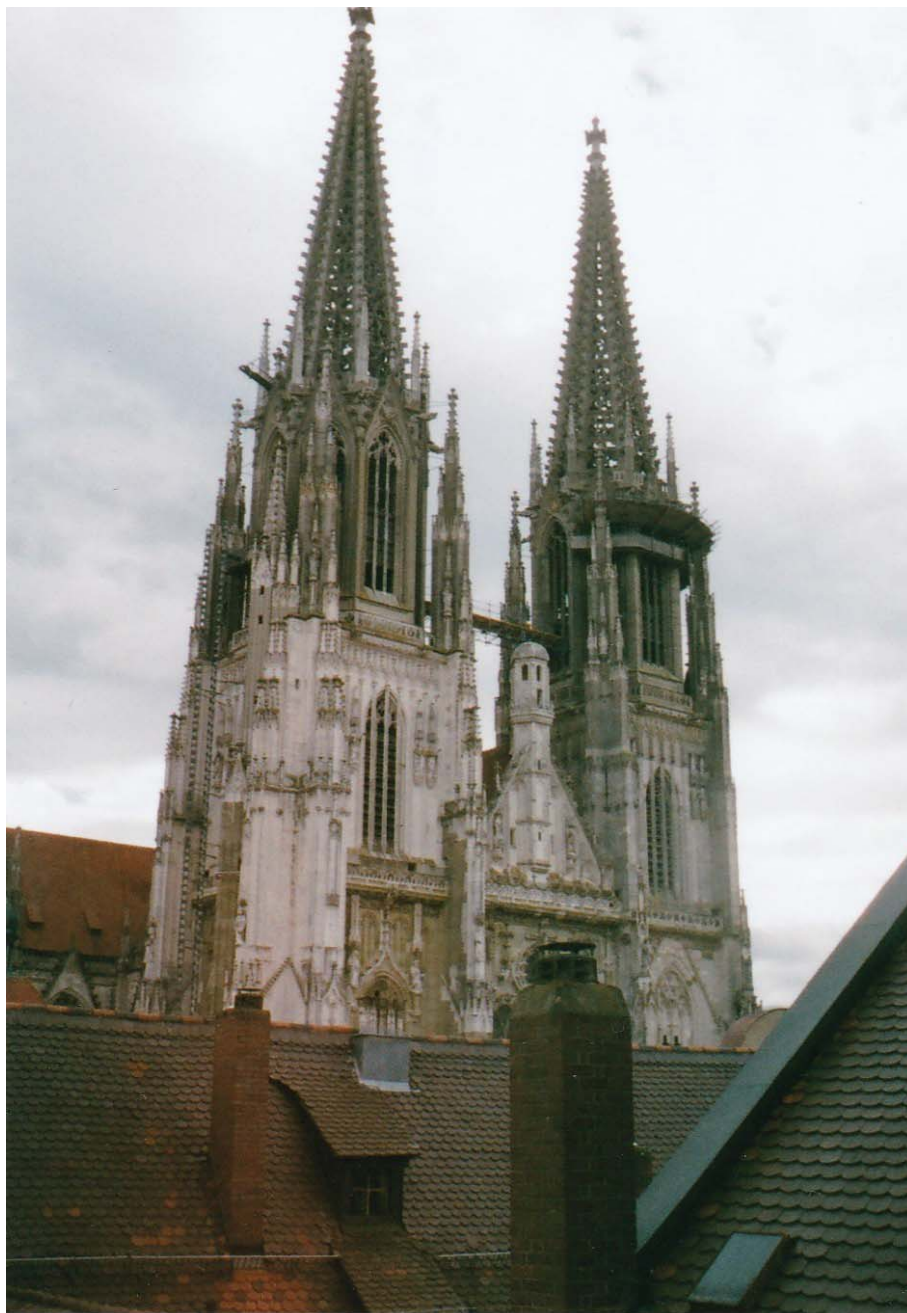
Regensburg: die Türme des Doms (, 18. 9. 2015)