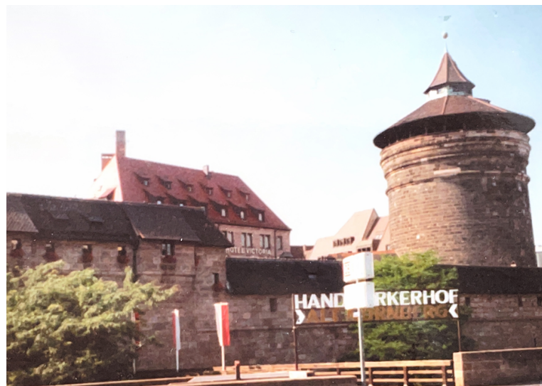
Der „Handwerkerhof“ von Nürnberg, Frankens größter und Bayerns zweitgrößter Stadt